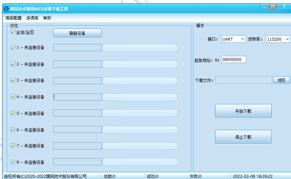
图 2-1 下载工具主界面