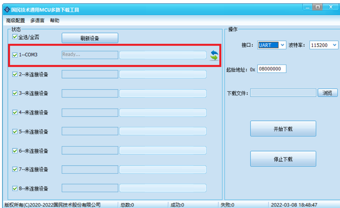
图 4-5 识别设备成功