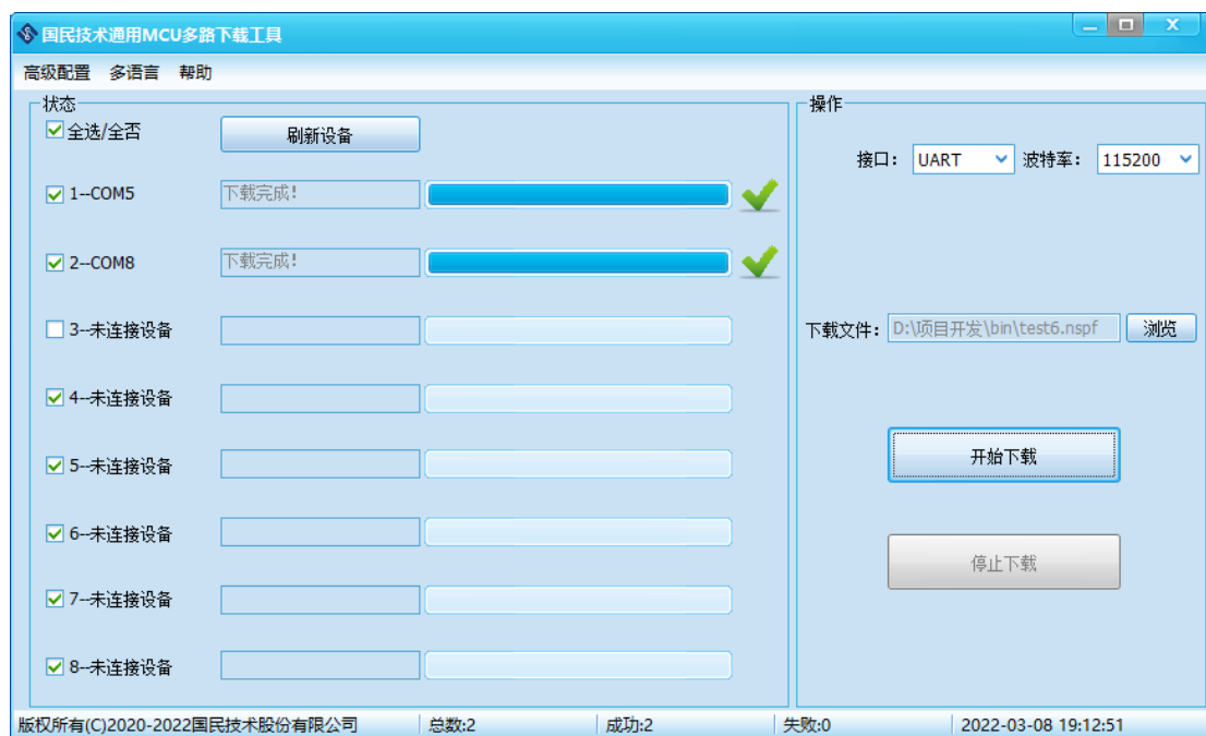
图 4-14 下载成功界面