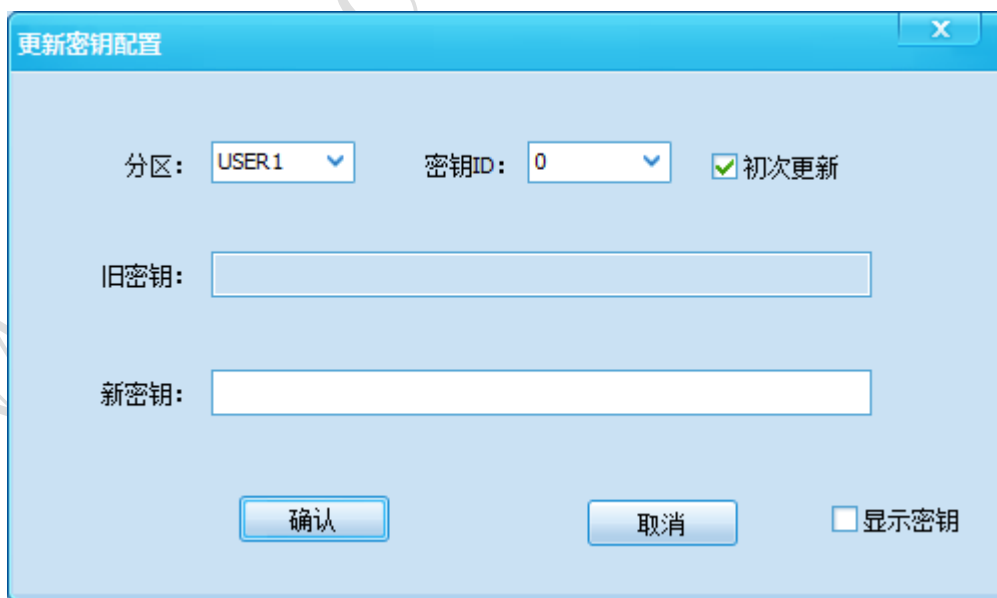
图 4-8 更新密钥