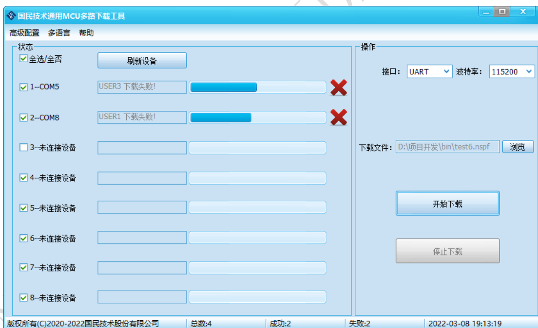
图 4-15 下载失败界面