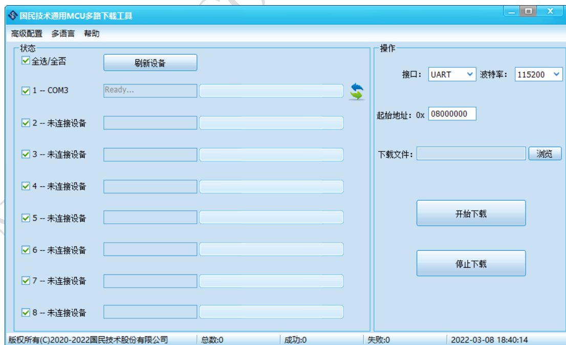
图 4-3 程序启动界面 (UART 接口)