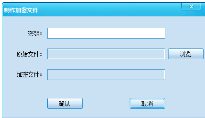
图 4-13 制作加密文件

如需对下载的文件进行加密，打开左上角的菜单项“高级配置”，选择“制作加密文件”，弹出对话框如图：