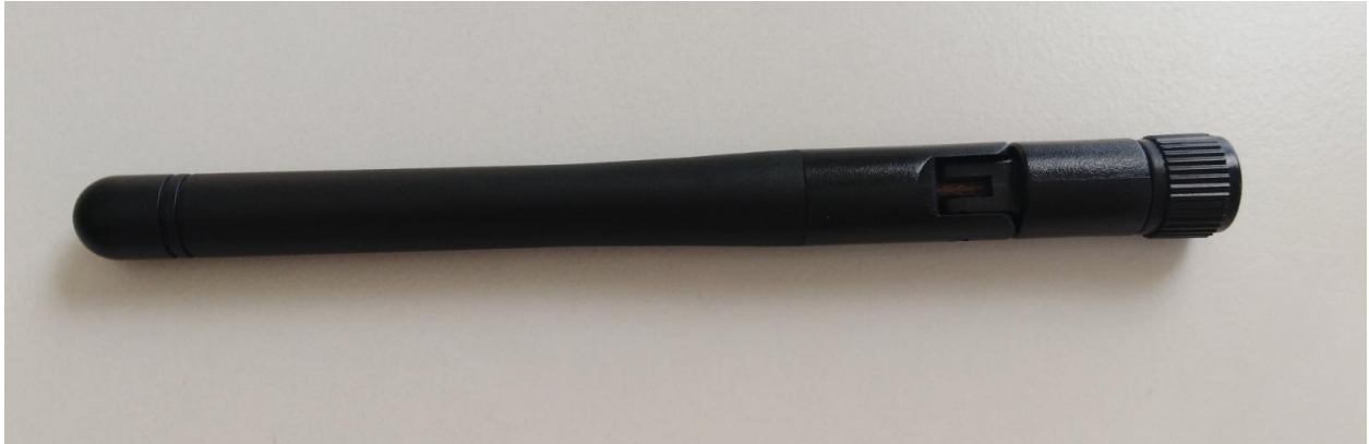
表1-1 3种类型天线的优缺点